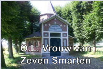
O.L. Vrouw van Zeven Smarten