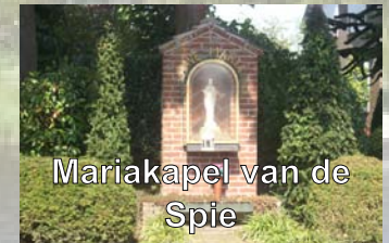
Mariakapel van de Spie