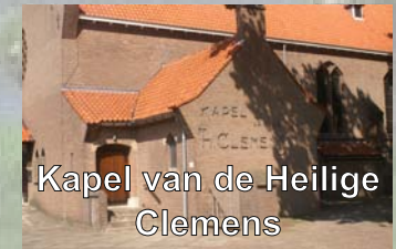
Kapel van de Heilige Clemens