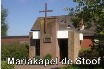
Mariakapel de Stooft