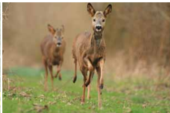
Houdt u rekening met ons?