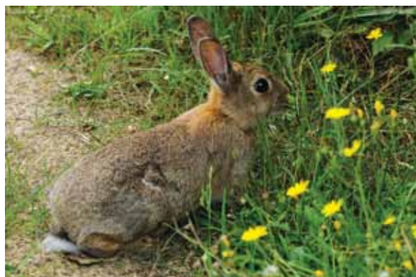
Houdt u rekening met ons?